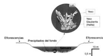
Salar de Llamara. Fuente Lòpez et al. 1999.

En términos generales se considera que la producción del yeso se encuentra ligada a los ciclos económicos, es decir cuando la actividad de la construcción crece la producción de este mineral la acompaña.