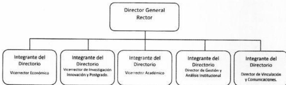
Figura N°1: Equipo Directivo.